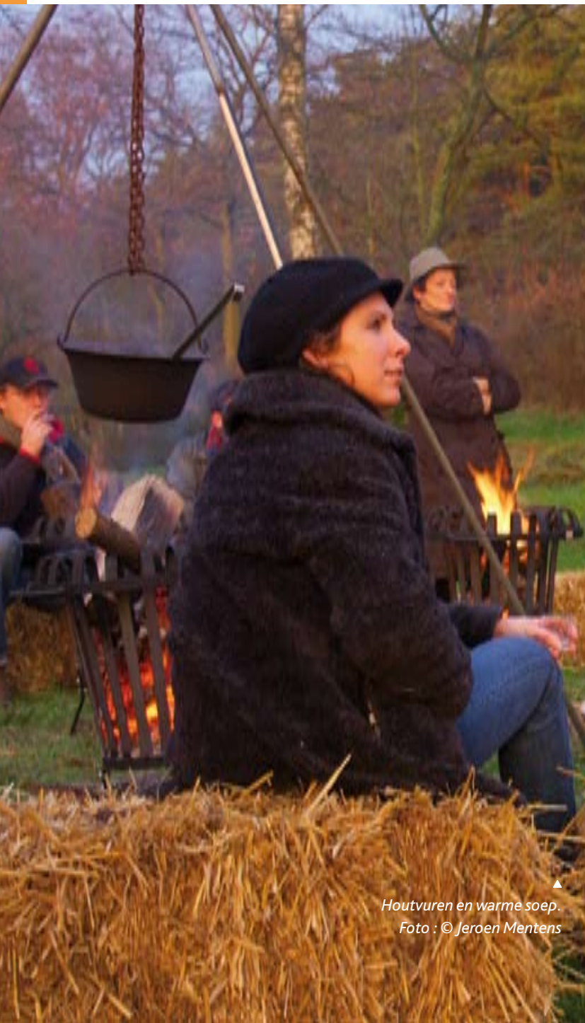
Houtvuren en warme soep.