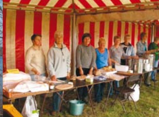
▲ De vriendinnen van de vrienden van het Schulensbroek.

jongeren strijken dan neer in het broek en zetten hun jeugdig geweld in voor het natuurbehoud. De vermaarde keukenploeg bestaat uit de vriendinnen van de vrienden van het Schulensbroek en is volgens de jeugdige gastronomen op weg naar een eerste Michelin ster.