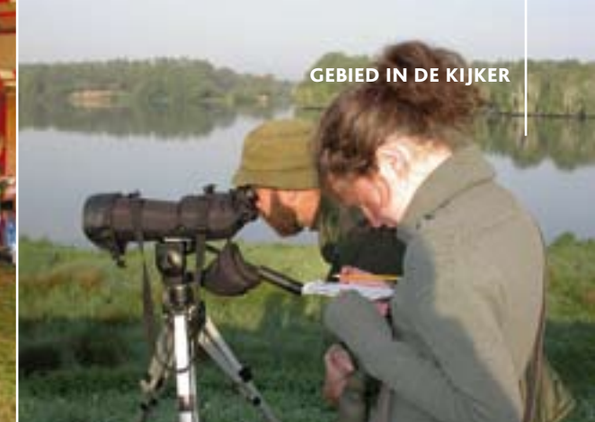
▲ Meer dan 250 vogelsoorten werden hier geregistreerd.

dijken rolt en er duidelijk leut in heeft. Een vos die in de ochtendnevel door de weiden sluipt. Een ijsvogel, een watersnip, een kleine vos ( dat is een vlinder ) of een nonnetje ( dat is een eend ). Je kan er intens van genieten en dit natuurerfgoed moeten we in de beste condities doorgeven aan de volgende generaties.