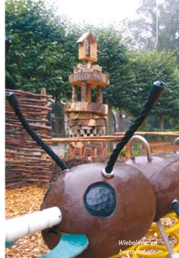
▲ Wiebelmier en beestentoren.

Openingsuren winkel: elke dag tussen 11.00 en 18.00 uur – maandag gesloten Reservering vergaderzolder : 011/24 60 20 (tijdens de kantooruren)