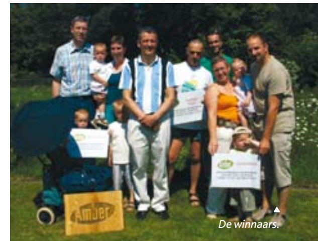
▲ De winnaars.