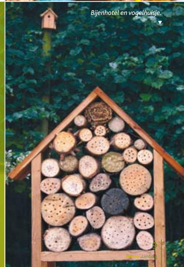
▼ Bijenhotel en vogelhuisje.