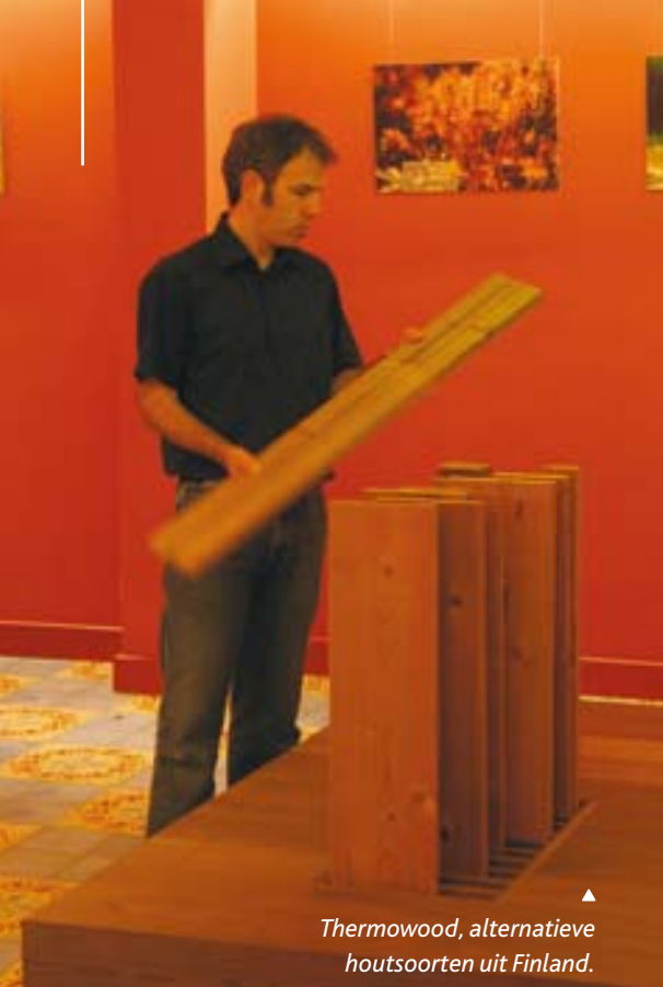
▲ Thermowood, alternatieve houtsoorten uit Finland.