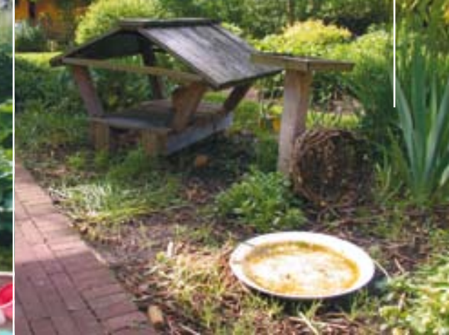
▲ Tuin van de familie Coquet met voedertafels, schaaltes met water en veel nestgelegenheid voor de vogels.

op hoe erg de vogels in deze tuin welkom zijn met heel wat mogelijkheden voor nestgelegenheid, voedertafels en schaaltes met water.