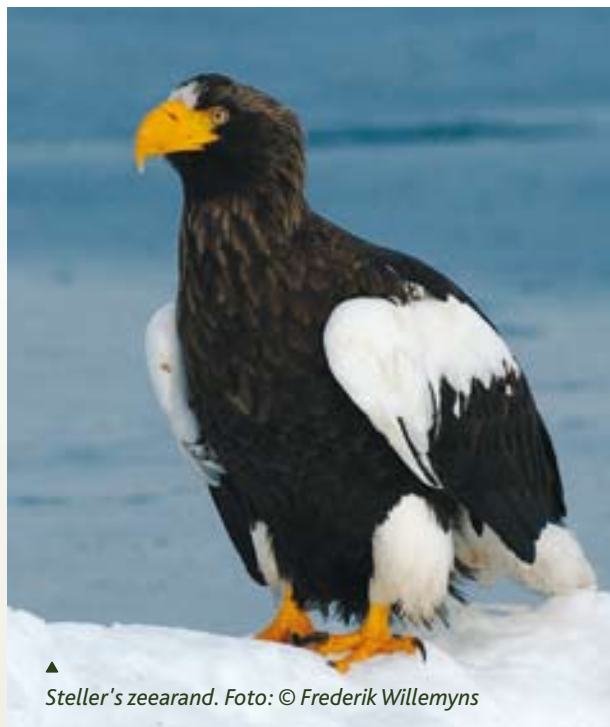
▲ Steller's zeearend.

Aanvang om 20.30 uur in ons natuarpunt in Kiewit. Inkom €5 maar op vertoon van je lidkaart mag je GRATIS binnen.